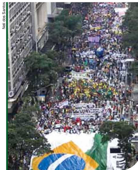
O PONTO CULMINANTE FOI A MARCHA DOS POVOS EM DEFESA DOS BENS COMUNS E CONTRA A MERCANTILIZAÇÃO DA MÃE TERRA, NO DIA 20 DE JUNHO, COM A PARTICIPAÇÃO DE CERCA DE 80 MIL PESSOAS QUE LOTOU A AVENIDA BRASIL, NO RIO DE JANEIRO.