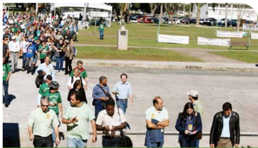
LÍDERES SINDICAIS SOBEM A RAMPA DO PALÁCIO IGUAÇU, SEGUIDOS DE CENTENAS DE SERVIDORES.

SINDICALISTAS DEFENDEM QUE O DESENQUADRAMENTO É UMA SITUAÇÃO INJUSTA.